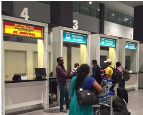
レベル1 バスチケット売り場

LEVEL1 にあるバスチケット売り場で TBS バスターミナルまでのチケット (RM10) を購入します。