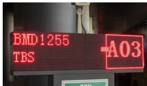
TBS バスターミナル行のバス乗り場